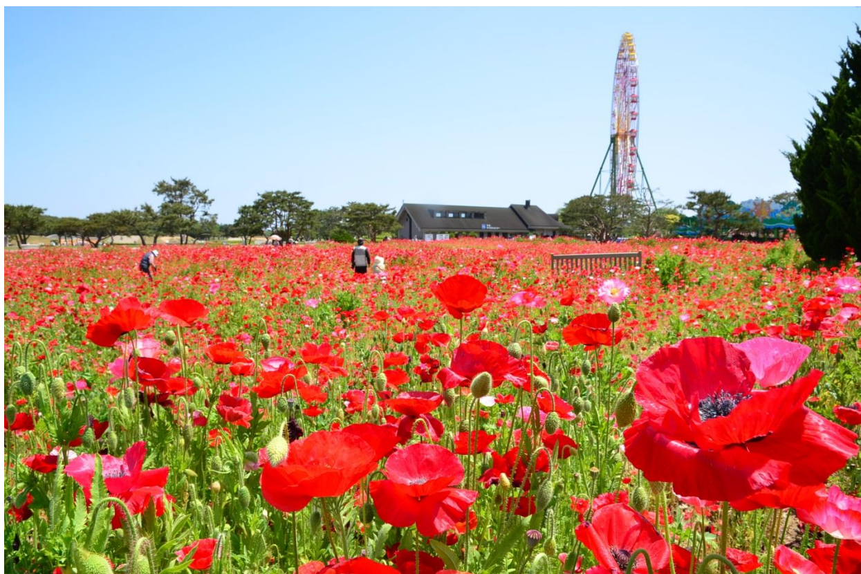
中央フラワーガーデンに咲くシャーレーポピー(2013年5月24日撮影)

季節は春から初夏へと変わり、暖かく穏やかな陽気が続いておりますが、ひたち海浜公園では、オレンジ色のカリフォルニアポピーに続き、真っ赤な35万本の シャーレーポピーも見頃を迎えました 。初夏の爽やかな風と光を浴びて蕾が次々に頭をもたげ、目に沁みるような鮮赤色の花を咲かせています。