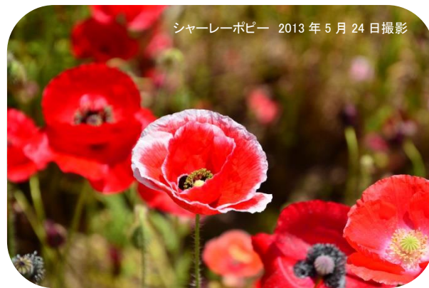
シャーレーポピー 2013年5月24日撮影

ケシ科の一年草。細長い花茎の先にまるで紙でできたような薄い花をつけ、頭を持ち上げるように咲きます。地中海原産といわれており、さわやかな気候の地域が故郷にあるため、風がよく通る水はけのいい場所で栽培されます。約150種のポピーが世界に分布していますが、日本では、ヒナゲシ（シャーレーポピー）、オニゲシ（オリエンタルポピー）、アイスランドポピーなどが多く植えられています。