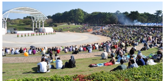
入園料無料日の 10/21 (日) 公園内の賑わう様子。 左：古民家でのボランティアまつり 右：オータムフェスティバル