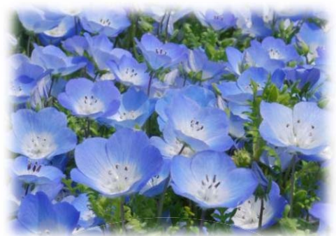
ネモフィラの花言葉

震災を経て、身近な人の大切さを改めて感じるようになり、家族の絆を深めるためにこの挙式で誓いをたてようと考えていらっしゃいます。