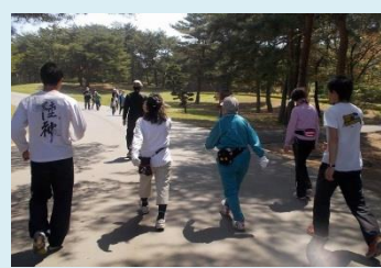
ウォーキング・ジョギング体験