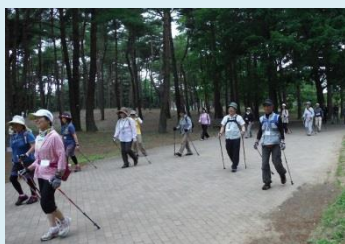
ノルディックウォーキング