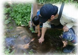
←沢田湧水地源頭部 2015年5月10日