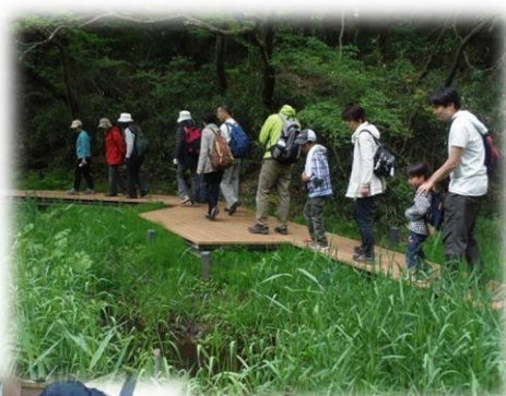
↑ガイドツアーの様子 2015年5月17日