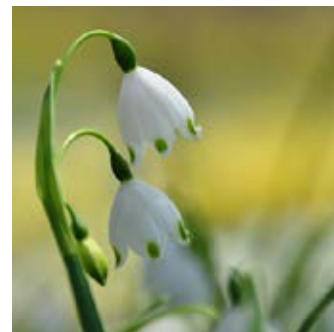
スズランスイセン (スノーフレック)