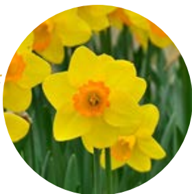
ひたちサンライズ 2015年4月4日撮影