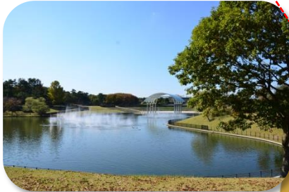
西池 池の周りをぐる~っとお散歩！