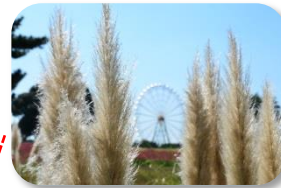
パンパスグラス まだ見られる箇所があります。