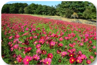
コスモス (ディープレッドキャンパス) 遅咲きの濃い赤色が秋空に映えます。