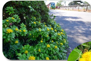
イソギク 小さな黄金色の花がかわいらしい。これから園内各所で見頃を迎えます。