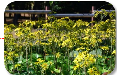
ツツキ 園内各所 晩秋の日差しを浴び、黄色の花々が光り輝きます。