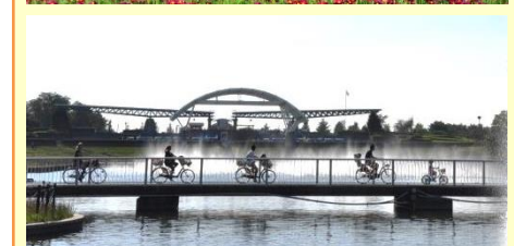
シーサイドトレインやサイクリングでの園内周遊もおススメです。