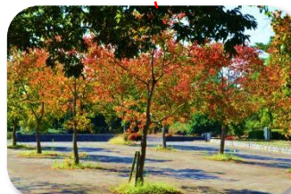
紅葉 園内で紅葉が見られる数少ないスポットです。