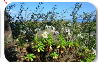
ハマギク ひたちなか市の花です。数は少ないですが、白い花が爽やかです。