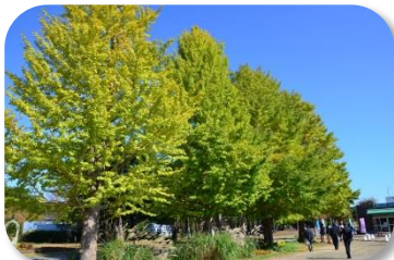
イチョウ 数は少ないですが黄葉が見られます。