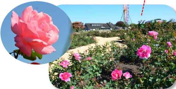
バラ 来春の全面オープンを前に一部プレオープン！深みのある色と、香りをお楽しみください。