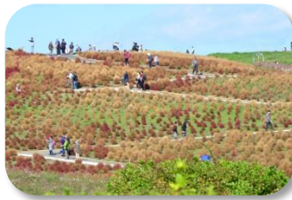
コキア 紅葉の見頃は過ぎましたが、茶色の葉も趣があります。