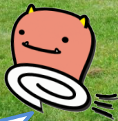
一般社団法人鬼ごっこ協会 公式キャラクター 「鬼ゴッター」