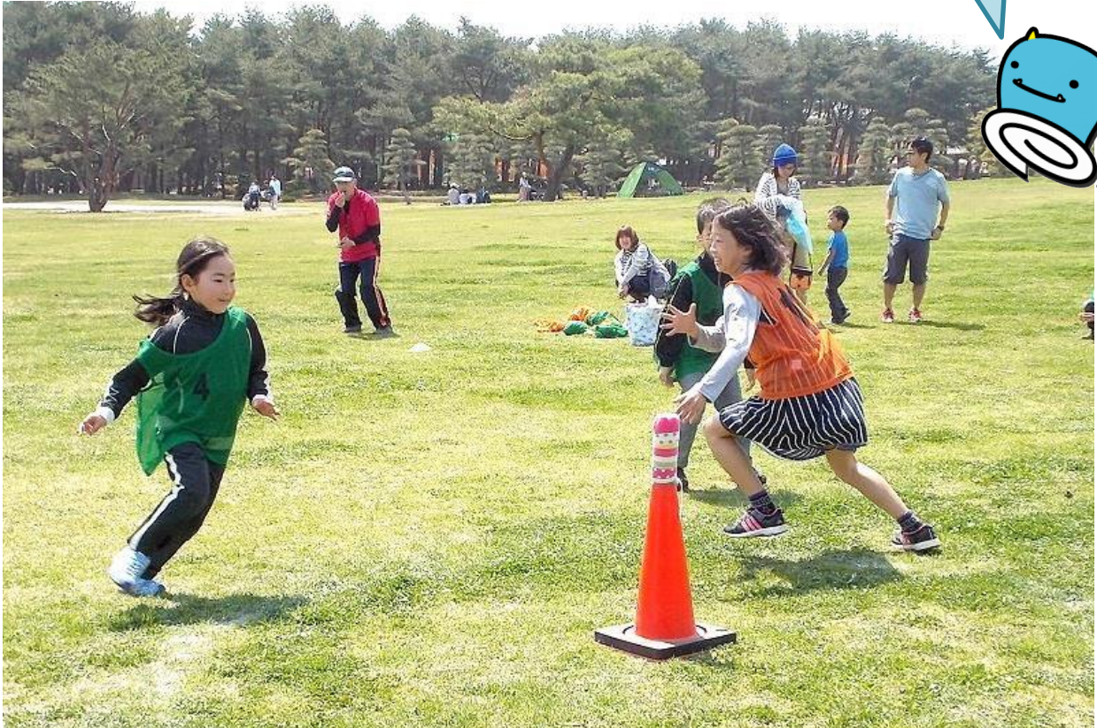
「チャレンジ!スポーツ鬼ごっこ」開催時の様子 2014年4月27日

そろそろ秋も中頃。日中も涼しい日が続き、スポーツを楽しむには最適な時期となりました。国営ひたち海浜公園では、10/26(日)にスポーツの秋にふさわしいイベント「 第3回スポーツ鬼ごっこ全国大会茨城予選会 」を開催します。