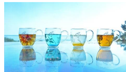
4種類の限定メニュー（2017年11月10日撮影）