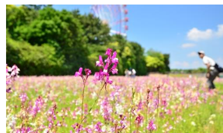
可愛らしく繊細な花姿 (2018年6月3日撮影)