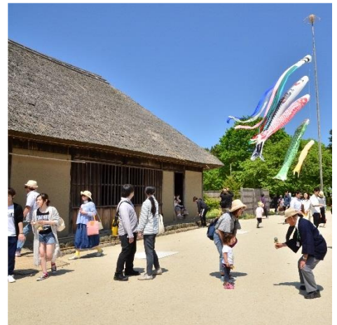
大勢の来園者で賑わう園内

国営ひたち海浜公園は、5月4日(金・祝)に開園以来の累計入園者数が3,000万人を突破しました。これもひとえに本公園をご利用くださるお客様と、日頃よりご支援とご協力をくださる関係者の皆様のおかげと心より感謝いたします。入園者2,000万人を達成したのが平成25年5月で、1,000万人達成から8年6カ月を要しましたが、今回はそれよりも短い4年11カ月での達成となりました。