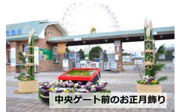
中央ゲート前のお正月飾り