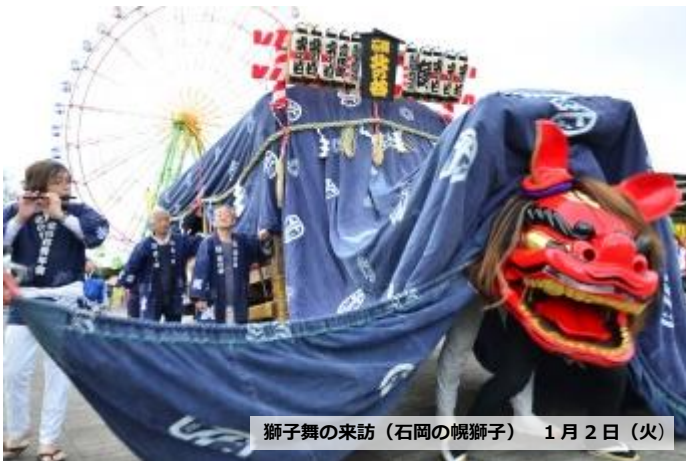
獅子舞の来訪(石岡の幌獅子) 1月2日(火)

国営ひたち海浜公園は1月2日(火)より開園し、新春を楽しく過ごすことができる様々なお正月行事を開催します！新春の雰囲気を感じ、2018年の干支「戌(いぬ)」の巨大地上絵やゲート前に登場するお正月飾りなども見所です。ご家族やお友達と一緒に、昔懐かしいお正月行事を体験してみませんか。