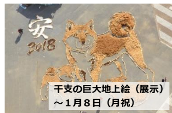
干支の巨大地上絵(展示) ～1月8日(月祝)