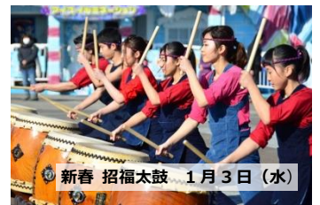
新春 招福太鼓 1月3日(水)