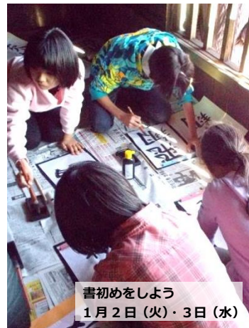
書初めをしよう 1月2日(火)・3日(水)