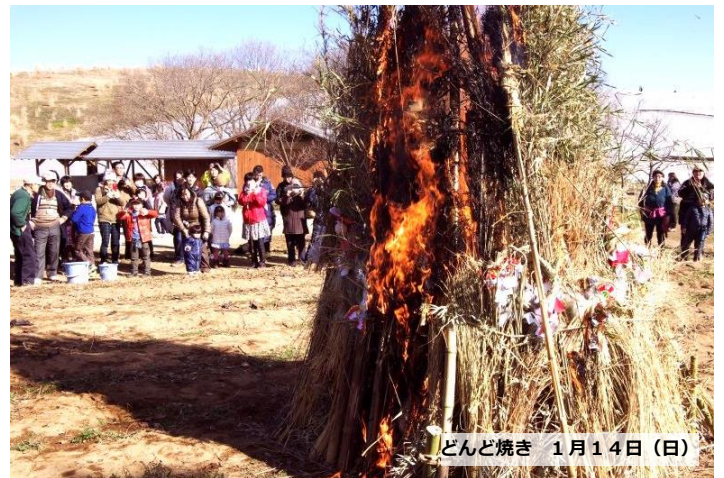
どんど焼き 1月14日(日)