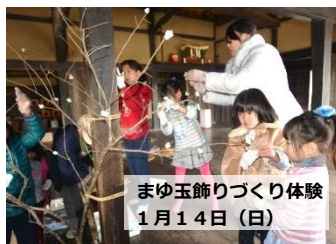
まゆ玉飾りづくり体験 1月14日(日)