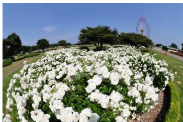
リラクゼーションガーデン (アイスバーグ/左・ラバグルート/右)