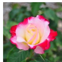
ダブルディライト