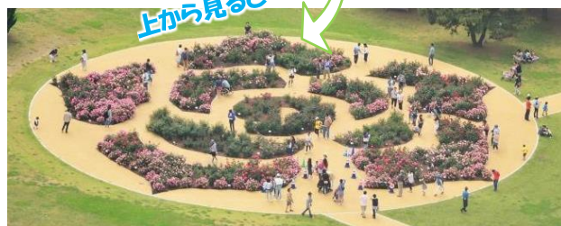
観覧車から見えるローズレリーフガーデン