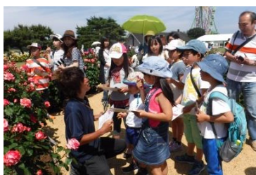
常陸ローズガーデンツアー