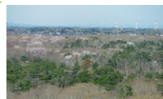
みはらしの丘第3頂上から

みはらしの丘の第3頂上から樹林地を見渡すと、所々に白や薄ピンクの塊（かたまり）が見えます。それがヤマザクラです。ネモフィラを見た後は、少し迂回して樹林エリアのルートを通ってみませんか？樹林エリア北側には「ヤマザクラ巨木林」があり、大きなヤマザクラが数多く生育しています。新緑の美しいこの時期、上を向いて歩いてみませんか？新たな発見があるかも。桜咲く森の中、新しいお花見の提案です。