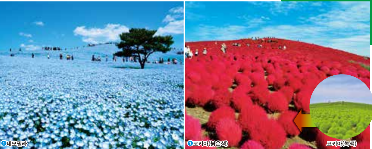
① 네모필라 ① 코키아(붉은색) 코키아(녹색)