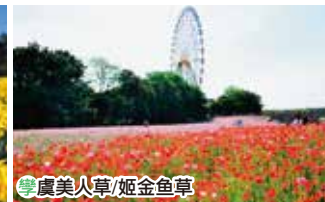
⑤ 虞美人草/姬金鱼草