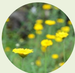
ダイヤーズ カモミール