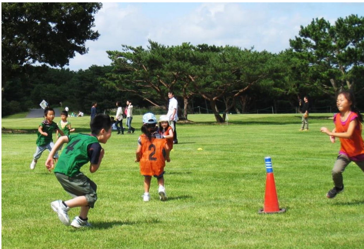
『チャレンジ！スポーツ鬼ごっこ』開催の様子 2013年9月23日撮影

日に日に気温が下がり、涼しい秋の気配が漂うようになりました。いよいよスポーツの季節が到来です。国営ひたち海浜公園では、来る 10月26日(土)に開催する『第2回 スポーツ鬼ごっこ 全国大会 茨城予選会』の出場者を募集中! 本イベントは、11月9日(土)・10日(日)に東京で開催される「第2回スポーツ鬼ごっこ全国大会」の公式予選会となっており、簡単なルールなのでどなたでもご参加いただけます。