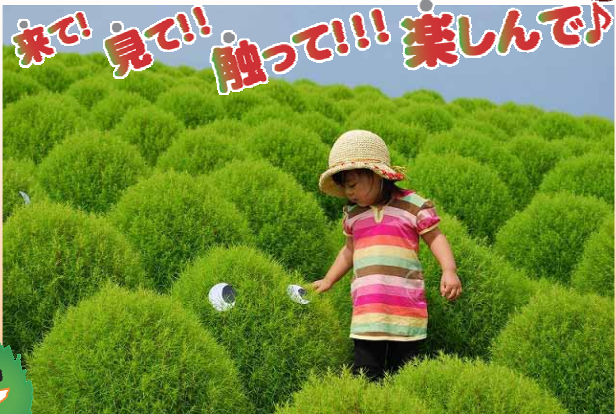
平成 21 年 8 月 22 日撮影