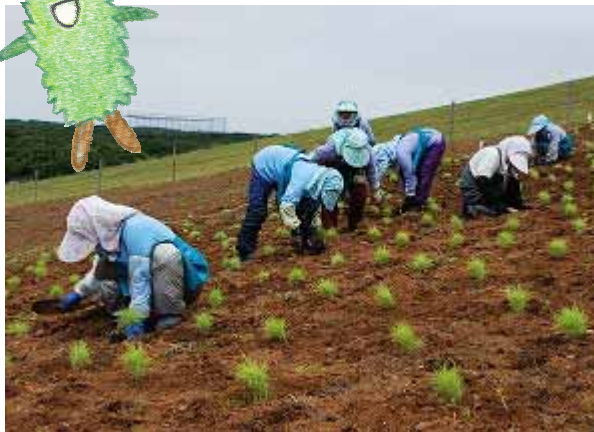
6月下旬に植付を行ったコキアですが・・・