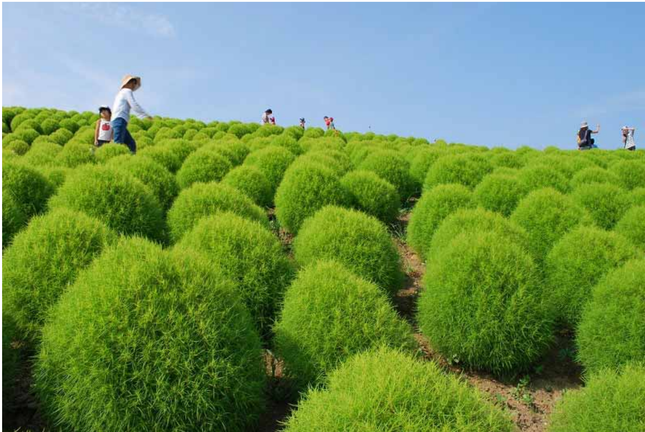
平成 21 年 8 月 22 日撮影