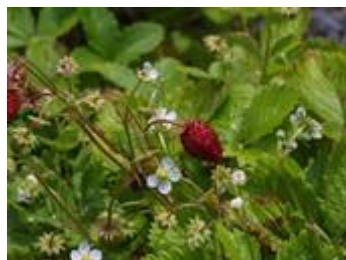
ワイルdstロベリー(バラ科)