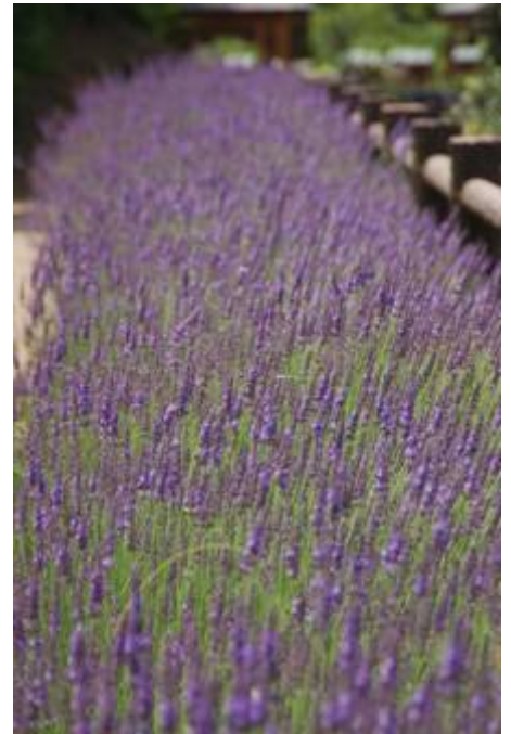
右：イングリッシュラベンダー