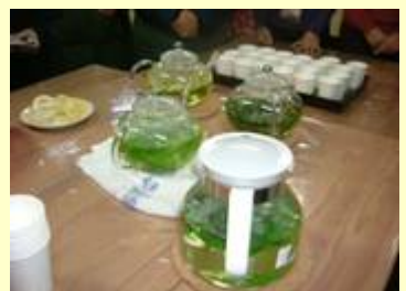
オリジナルブレンドのハーブティ