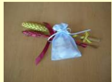
ラベンダースティックとサシェ

※なお、ハーブティのサービスは、「香りの谷でハーブティサービス」と題し、7月19日(日)にも開催します。(先着500名)