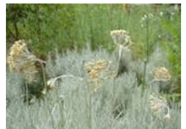
カレープラント(キク科)