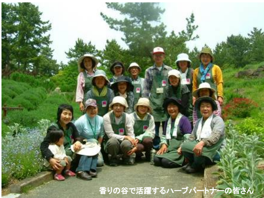
香りの谷で活躍するハーブパートナーの皆さん