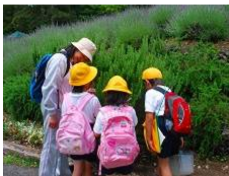
実際に触って、香りを楽しんでみてくださいね。

ハーブは見て美しいだけでなく、香りも楽しめるし、料理やお茶に使ったり、いろいろな楽しみ方ができるので、初めての方にとっても親しみやすいと思います。