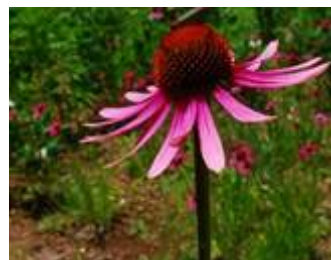
エキナセア(キク科)