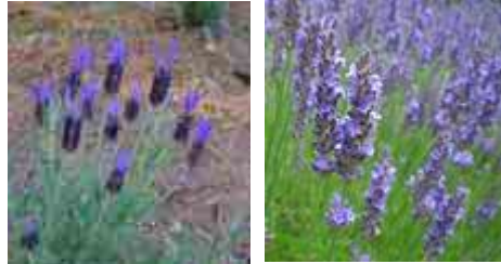
左：フレンチラベンダー

品種には、香りの高いイングリッシュラベンダー、暑さに強く丈夫なスパイクラベンダーのほかに、花も美しく香りもよく、生育旺盛なラバンジン(イングリッシュラベンダーとスパイクラベンダーの交配種)、花穂がふっくらと太く短く、ウサギの耳のような葉が特徴のフレンチラベンダー等があります。