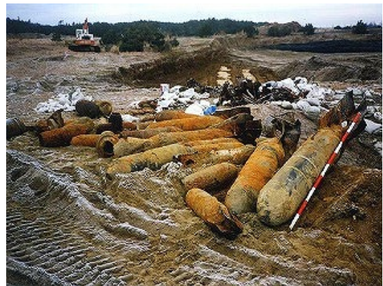
建設中に多数発見された不発弾