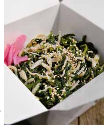
シラスを惜しげもなく使った「しらす飯」