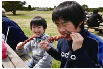
ボリューム満点!! “ハム焼き”