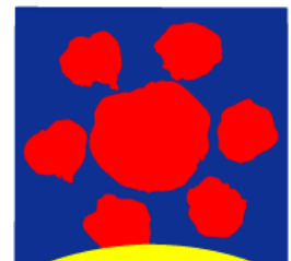
ひたち海浜公園 ロゴマーク