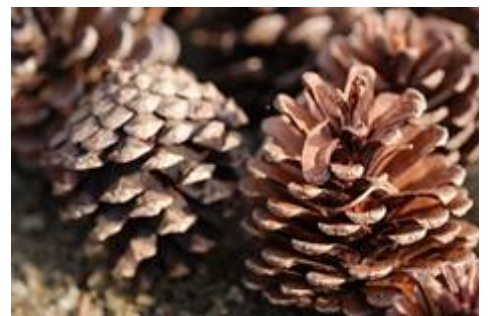
園内で採れた“まつぼっくり”

そのほか、園内で発生した「マツの間伐材」で牛の輪郭を縁取り、「間伐材で作った炭」で牛の目を作ります。ひたち海浜公園らしい素材にとことんこだわって作る「巨大松ぼっくりツリー」と、「巨大地上絵」を是非ご覧ください。