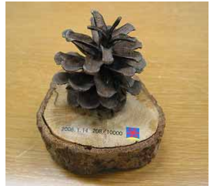
イベント最終日(1/12)に実施する「ありがとう！まつぼっくりツリー」で、年始の縁起物としてプレゼントするシリアルナンバー入りまつぼっくり