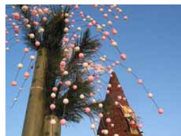
昨年度実施風景 (模様替えされた巨大松ぼっくりツリー)