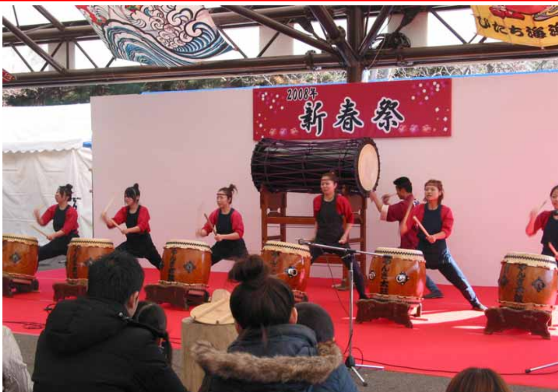
昨年度実施風景(平成二十年一月二日撮影)

「巨大松ぼっくりツリー」「巨大地上絵」も正月風に模様替え!(12月27日(土)～)