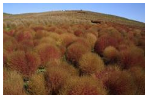
みはらしの丘の“コキア”