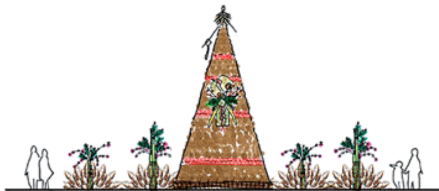
正月リニューアルイメージ