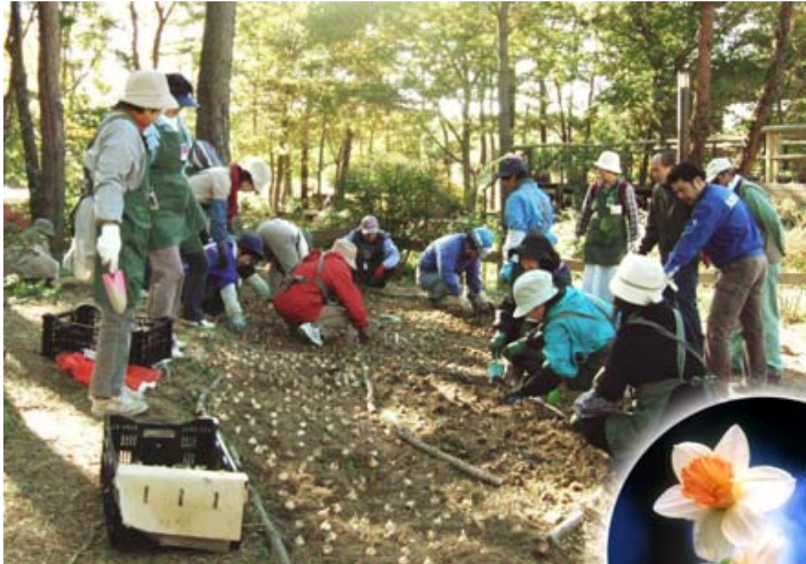
昨年度植え付け作業の様子(平成 19 年 11 月 22 日(木)撮影)