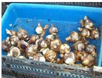
プリンセス・キコの球根