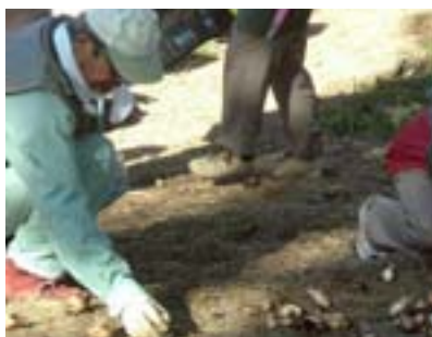
球根植え付け作業