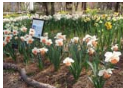
今春のプリンセス・キコ開花の様子