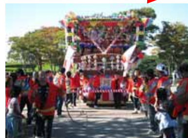
大助囃子の山車曳き(那珂市)