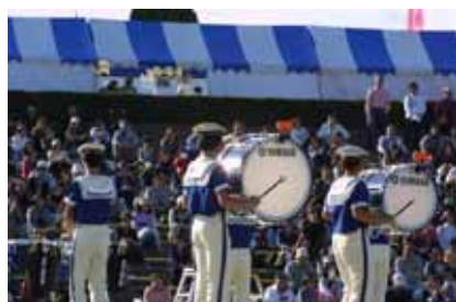
大洗高校マーチングバンド部 BLUE HAWKS