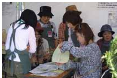
ミニブーケ作り(ひたち海浜公園)