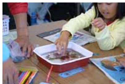
海藻の押し葉しおり(大洗「海の大学」)

大洗町のテントでは、海産物が豊富な町ならではの“海藻の押し葉しおり作り”や“はまぐり貝殻アート”が体験できるほか、ひたち海浜公園のテントでは、園内で採れたハーブを使ったサシェ（香り袋）やミニブーケ作り（協力:公園ボランティア「ハーブパートナー」）をお楽しみいただけます。