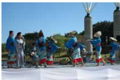
磯節(ひたちなか市)