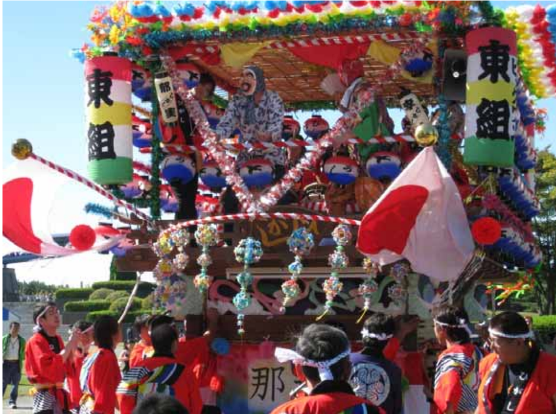
大助雛子(那珂市)の山車曳き 平成十九年十月二十一日(日)撮影