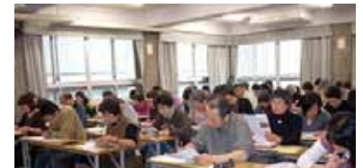
楽しみながら 試験にとりくむ受験者ら