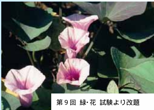
第9回 緑・花 試験より改題