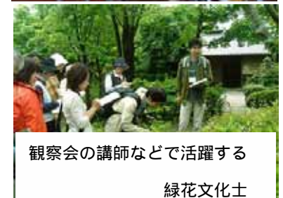
観察会の講師などで活躍する 緑花文化士