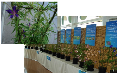
変わったアサガオがいっぱい！