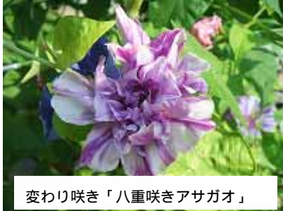
変わり咲き「八重咲きアサガオ」