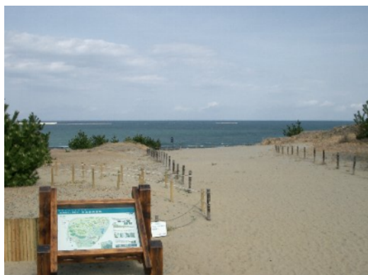
砂丘観察園路・広場

そこで、本来の砂丘景観を保全すべく、クロマツ・チガヤ等を排除し、砂の移動を促進することで、ハマヒルガオなどの海浜性草本の回復を促す工事を実施しています。さらに、地元海浜部のシンボルであるスカシユリの球根を園内の圃場で増殖させ、園路沿いへの植え付けを行っています。