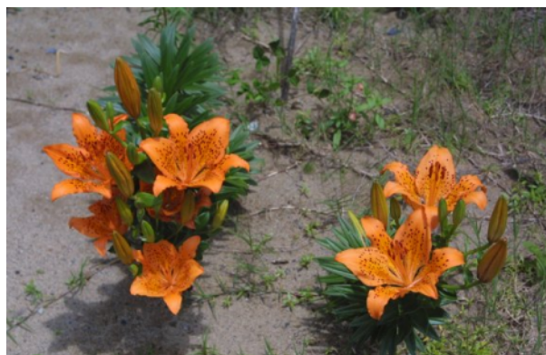
砂丘に咲くスカシユリ