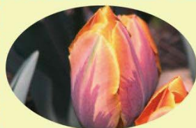
プリンセスイレーネ