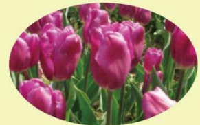
パープルフラッグ