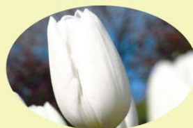
ホホワイトドリーム