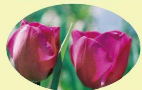
アッティラズレコード