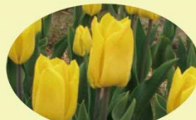
イエローフライト