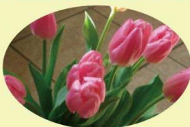
クリスマスドリーム