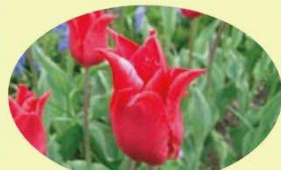
プリティーウーマン