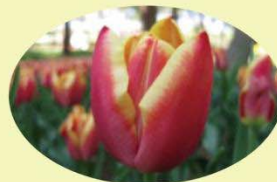
リンファンダーマーク