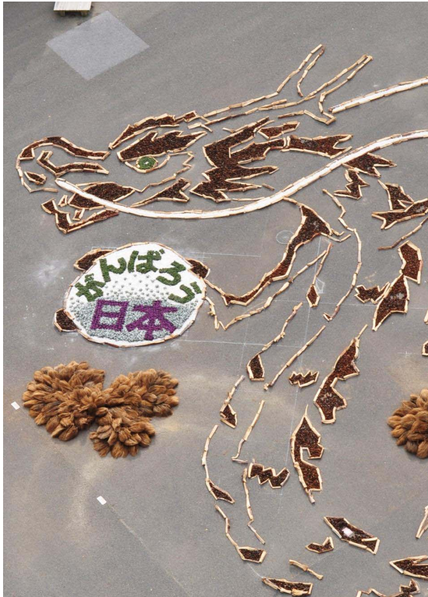
『大観覧車から見た龍の巨大地上絵』 2011年12月16日 撮影

先日ご案内しました来年の干支にちなんだ「辰」の巨大地上絵が、本日完成しましたのでお知らせいたします。 12月10日(土)から16日(金)の期間『みんなでアート』巨大地上絵をつくろう!』と題して、来園者の方々と共に、マツの間伐材の縁取りに「まつぼっ