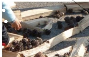
まつぼっくり、アカマツの間伐材 22,000 個のまつぼっくり