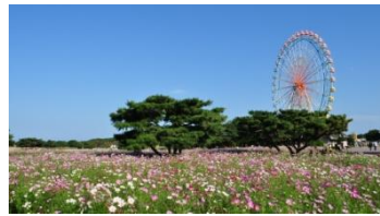
『みはらしの丘』(本数: 200万本、面積: 20,000㎡)