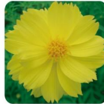
カーペットイエロー 暑さに強いキバナコスモスの品種です。