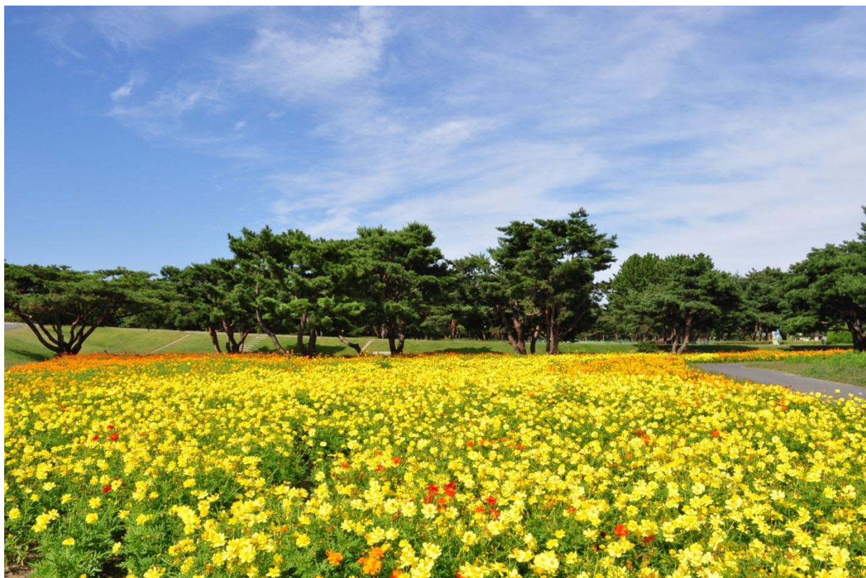
『中央フラワーガーデン（第3ガーデン）のキバナコスモス』 2011年9月28日撮影

国営ひたち海浜公園の中央フラワーガーデンでは、秋本番を告げるキバナコスモスが見頃を迎えています。中央フラワーガーデンでは、キバナコスモスから始まり、キャンパスシリーズで幕を閉じるコスモスリレーがスタートしました。