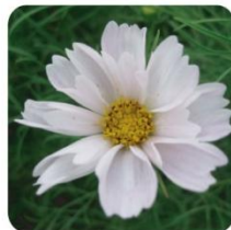
シーシェル 花びらが筒状に咲く変わり咲き品種です。