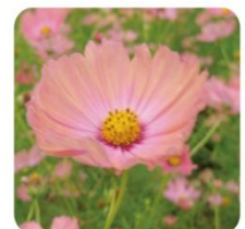
オレンジキャンパス 世界的にも珍しい淡いオレンジの花色が特徴の品種です。