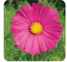
クリムゾンキャンパス クリムゾン色が特徴の遅咲き品種です。