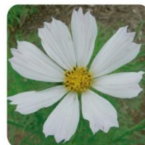
ベルサイユホワイト 大輪で早咲き、気品のある花色が特徴の品種です。