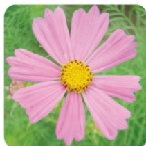
センセーション もっともポピュラーな早咲き品種です。