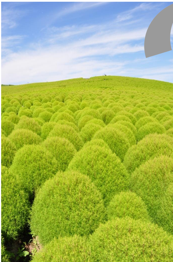
現在のコキアの様子 (2011年8月30日撮影)