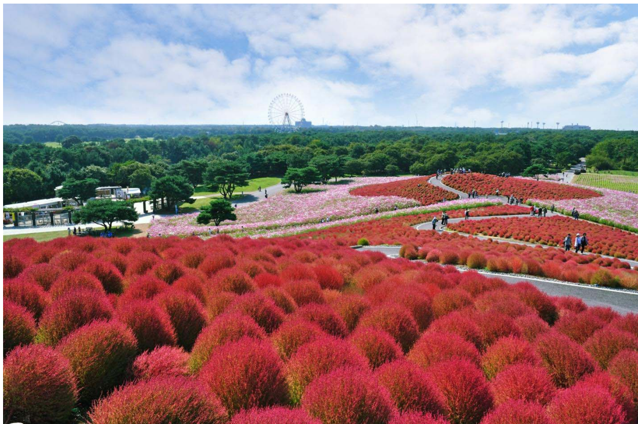
昨年の「みはらしの丘」のコキア（2010年10月18日撮影）

国営ひたち海浜公園では、みはらしの丘の“紅葉する不思議な草”コキアが順調に生育しています。