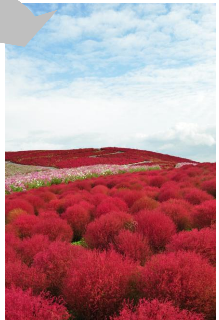
昨年のコキアの紅葉 (2010年10月22日撮影)

今年のコキアは大きなもので高さ 80 センチにもなり、“ふわふわ、もこもこ”としたコキアが丘一面にギッシリ勢ぞろい。ユニークな風景を創り出しています。現在は爽やかな緑に包まれた丘も9月下旬には紅葉し始めます。