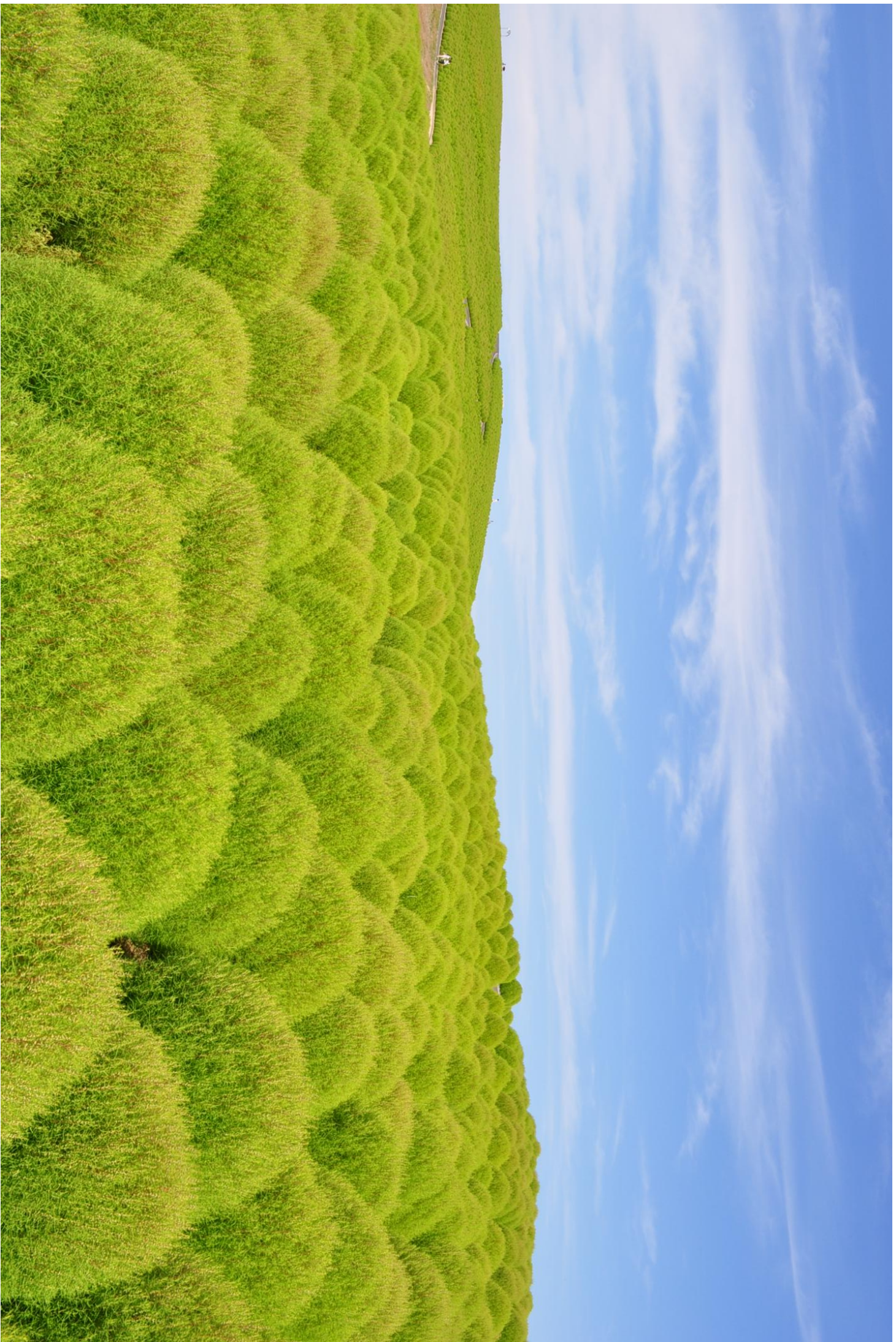
現在のコキアの様子 (2011年8月30日撮影)