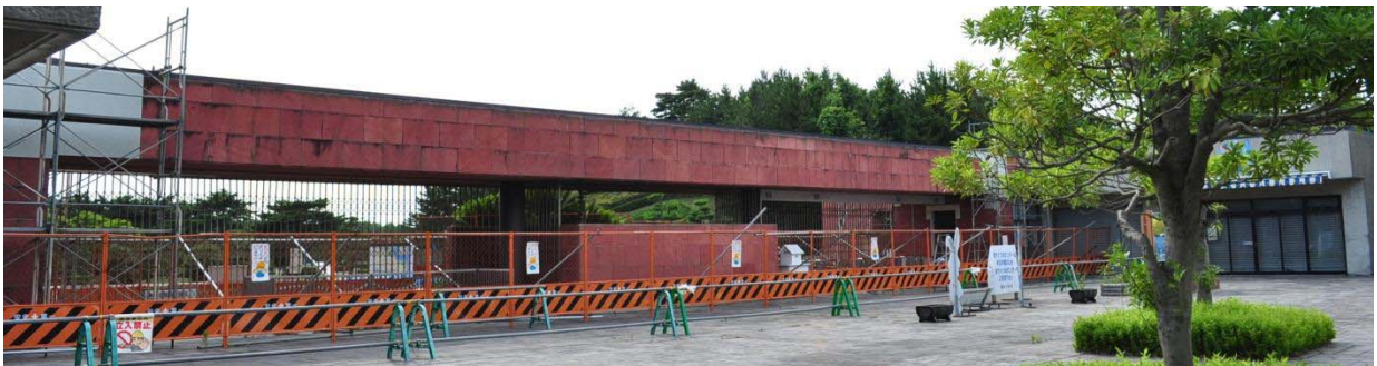
復旧工事完成間近 平成23年7月24日撮影

国営ひたち海浜公園の南口・赤のゲートは東日本大震災による被害のため、利用を見合わせていましたが、この度、復旧作業を終え、8月1日より通常通りご利用いただけることとなりました。今後南口エリアをご利用いただく際には、以前同様、南口・赤のゲートをご利用ください。