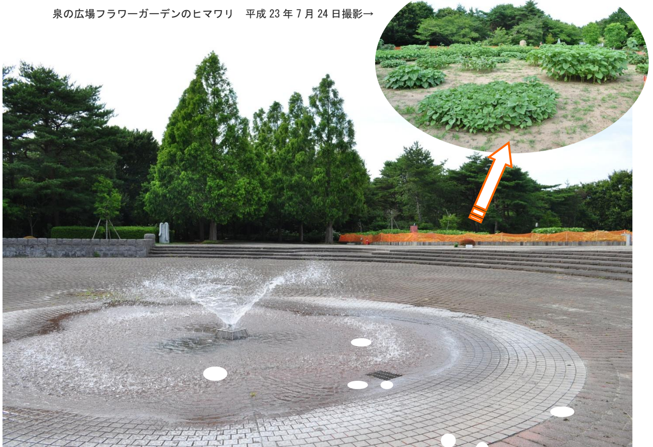
南口エリアの泉広場 平成 23 年 7 月 24 日撮影