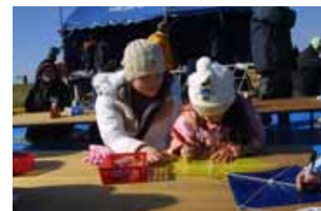
日本のお正月はやっぱり凧!