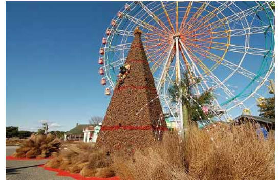
12月26日(土)には、お正月風に模様替えします。

太陽の燃え盛る炎は、この秋、多くのお客様にお楽しみいただいた“みはらしの丘”のコキアで表現しています。