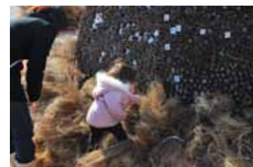
縁起を担いでお守りにする人も!