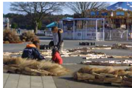
昨年度の地上絵制作の様子