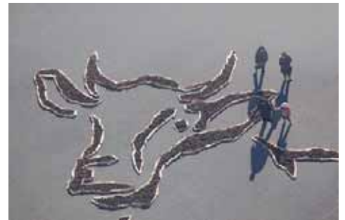
来年の干支、「寅」が登場します。

寅の輪郭は「マツの間伐材」で縁取り、寅の目は園内で発生した間伐材で作った「炭」を使用します。寅の足元には、草原をコキアで表現しています。