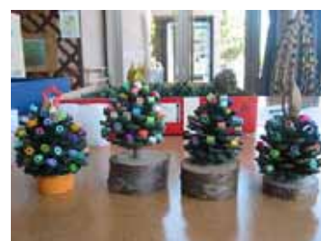
まつぼっくりで作ったツリー