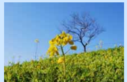
寒咲きハナナ(伏見寒咲)