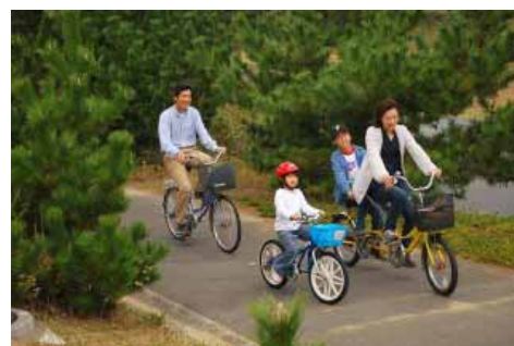
サイクリングで体もぼっかぼか!