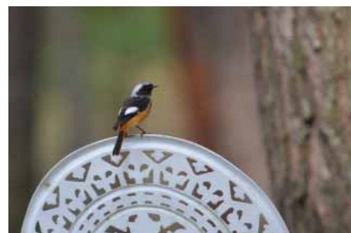
ジョウビタキにも会えるかも!?