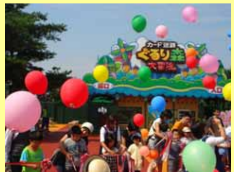
昨年オープンしたカード迷路のオープニングイベントの様子