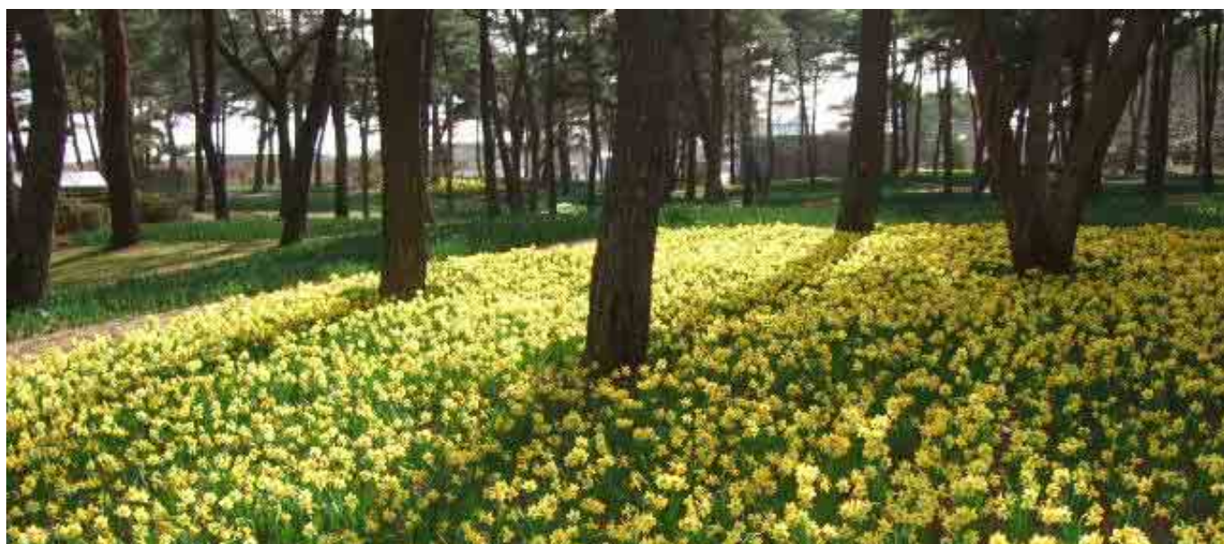
平成22年3月21日 テタテト満開