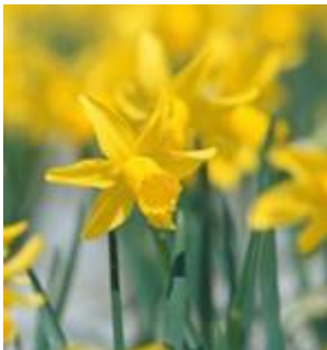
品種: フェブラリーゴールド

ミニスイセンとして人気の高い花。小さくて可憐ですが、とても丈夫で育てやすい。スイセンガーデンで、最初に咲き始めた品種です。現在、見頃を迎え、一面に咲き誇っている姿をご覧ください。