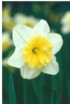
品種: アイスフォリス