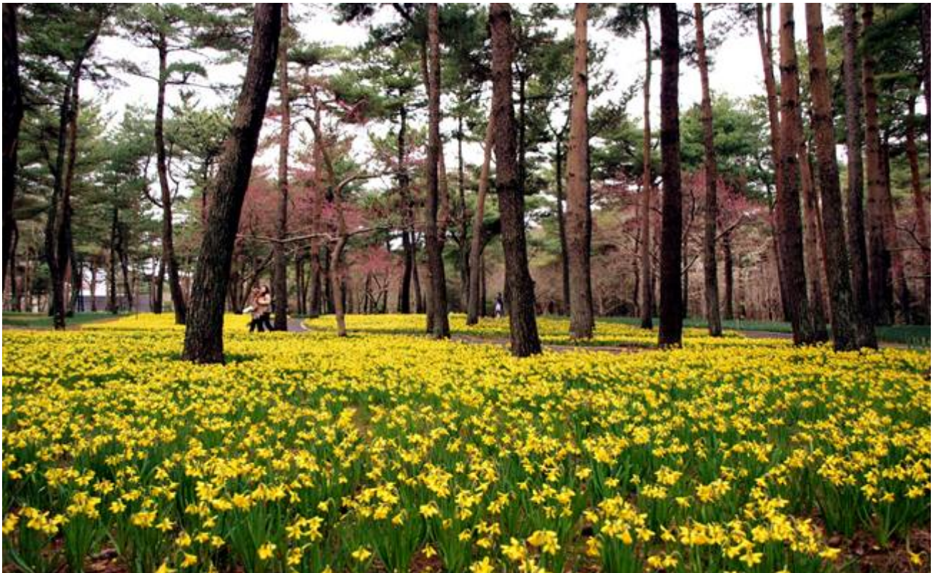
平成 22 年 3 月 26 日 スイセン(テタテート)開花状況