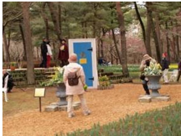
平成22年3月26日 スイセンみはらし台付近の様子