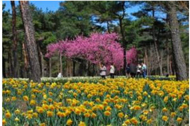
平成21年4月2日 昨年のスイセンガーデンの様子