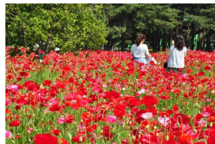
シャーレーポピー