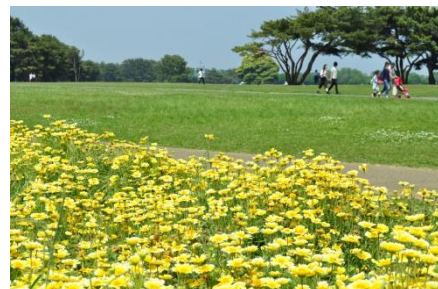
ツマジロヒナギク