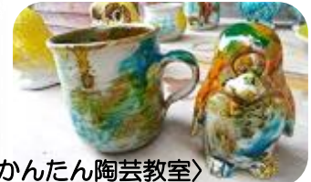
〈かんたん陶芸教室〉