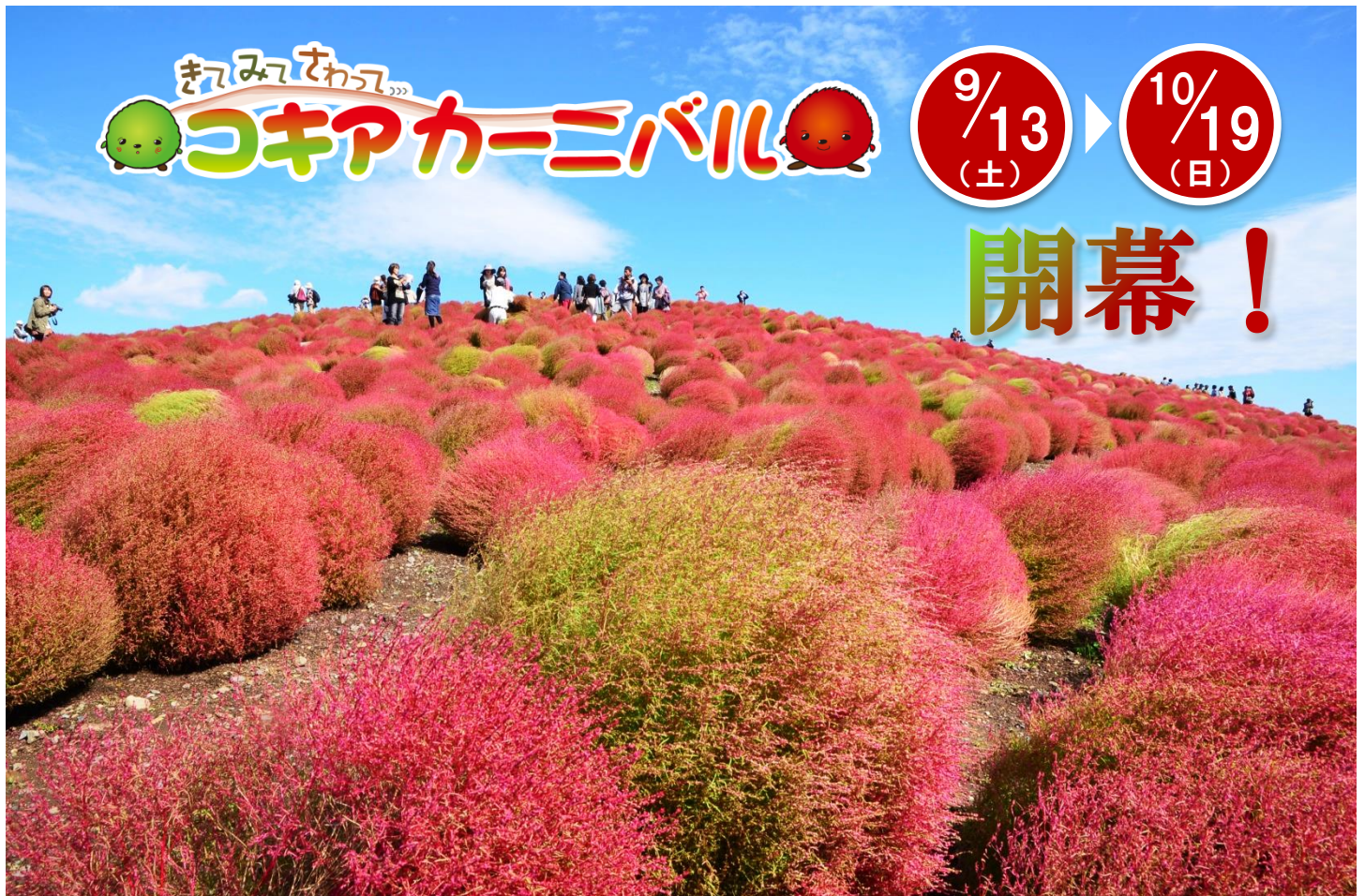
昨年のコキア紅葉風景 2013年10月17日撮影

澄んだ青空に秋の気配を感じる今日この頃。国営ひたち海浜公園のみはらしの丘のコキアもこれから訪れる秋に向けて衣替えを始めます。