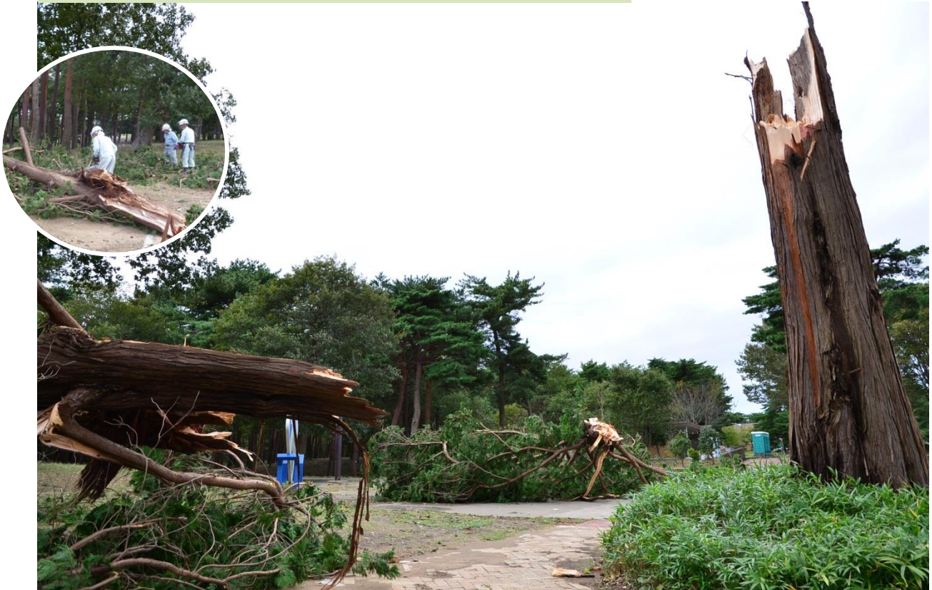
大人の一抱え以上もある太い木が強風で倒れるなど、倒木も多々ありました 2013 年 10 月 16 日撮影