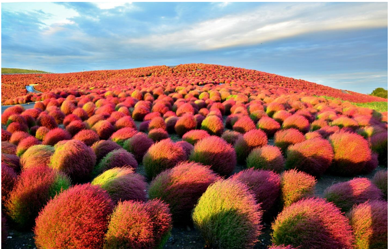
台風26号を無事耐え抜いたコキア 2013年10月16日撮影

過去10年で一番勢力の強いと言われた台風26号が16日(水)の夜半から早朝にかけて関東地方に接近し、 本公園でも冠水や倒木、各種草花の倒伏など大きな被害を受けました。