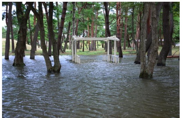
サイクリングコースや林の中に冠水箇所も 2013 年 10 月 16 日撮影