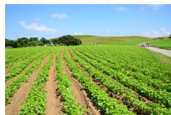
※現在の様子 2013年9月19日撮影