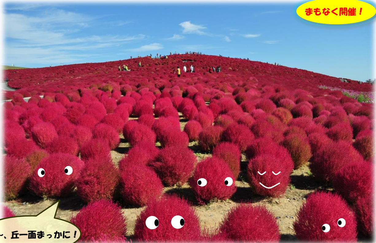
みはらしの丘一面のコキアが紅葉した様子 2012年10月16日撮影

徐々に残暑も和らいできて、朝夕の涼しさに秋の訪れを感じるようになりました。国営ひたち海浜公園の「みはらしの丘」では、“紅葉する不思議な草”コキアの色が少しずつ変わり始めています。猛暑にも負けず大きく生長した32,000本のコキアは“ふわふわ、もこもこ”としたユニークな姿で小高い丘を埋め尽くしています。10月中旬頃には、まるで恋した乙女のように真っ赤に紅葉するコキアと咲き誇るコスモスが見事な景観を創り出します。