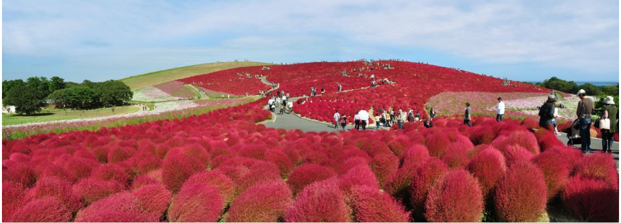
コキアが紅葉した『みはらしの丘』 2012年10月17日撮影

『きて、みて、さわって、コキアカーニバル』開催期間中は、コキアとともに秋の花や各種イベントをお楽しみいただけます。その他、地元茨城の食材や特産品を味わえる臨時売店「いばらき うまいもんどころ」を設置。地元のグルメと公園オリジナルスイーツをお楽しみください。