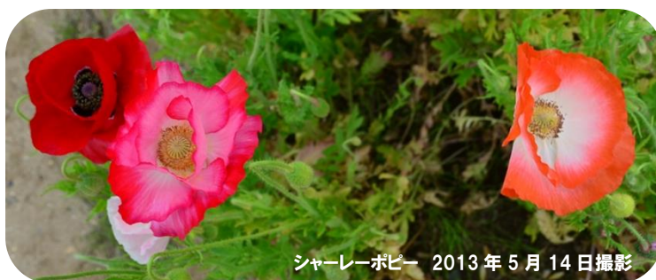
シャーレーポピー 2013年5月14日撮影

ケシ科の一年草。細長い花茎の先にまるで紙でできたような薄い花をつけ、頭を持ち上げるように咲きます。約 150 種のポピーが世界に分布していますが、日本では、ヒナゲシ(シャーレーポピー)、オニゲシ(オリエンタルポピー)、アイスランドポピーなどが多く植えられています。