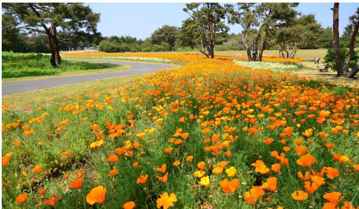
中央フラワーガーデンに咲くカリフォルニアポピー（2013年5月16日撮影）

先日14日(火)に茨城県内で真夏日を記録しましたが、朝晩はまだ肌寒い日が続いています。そんな中、国営ひたち海浜公園の中央フラワーガーデンで、色鮮やかな カリフォルニアポピーが満開 となりました。オレンジやクリーム色の小さな花の絨毯が初夏の風に揺れる様子は、観る人の心を和ませます。隣接する花畑では、シャーレーポピーも咲き始めました。