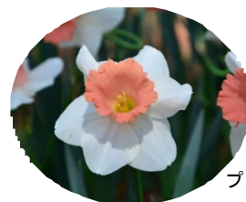
プリンセス・キコ