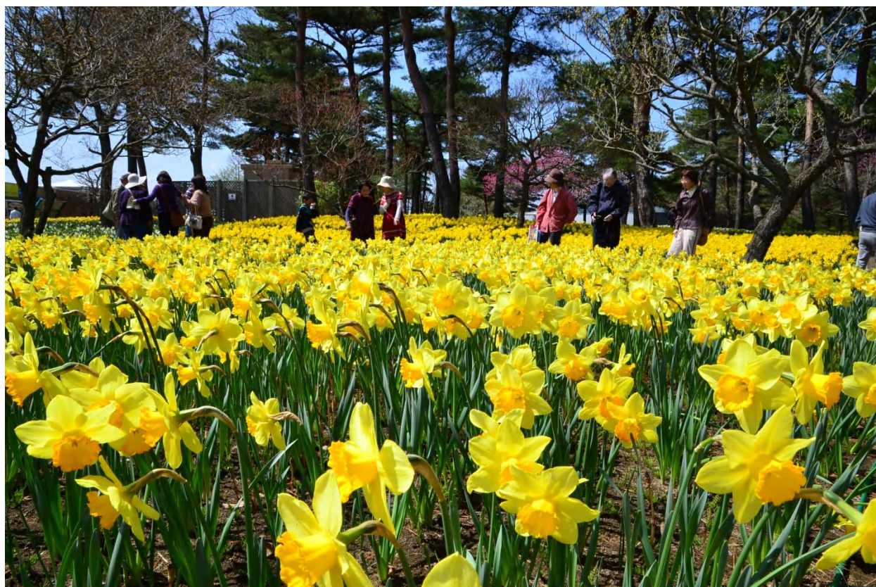
見頃を迎えたスイセンガーデン 2013年4月4日撮影

「スイセンガーデン」の花々が見頃を迎え、いよいよフラワーシーズンが開幕します。本格的な春の訪れを、昼夜で異なる「スイセンガーデン」の魅力とともに楽しみください。