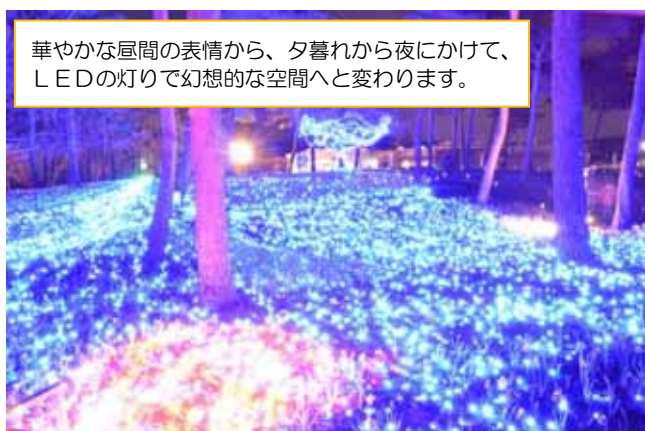
華やかな昼間の表情から、夕暮れから夜にかけて、LEDの灯りで幻想的な空間へと変わります。