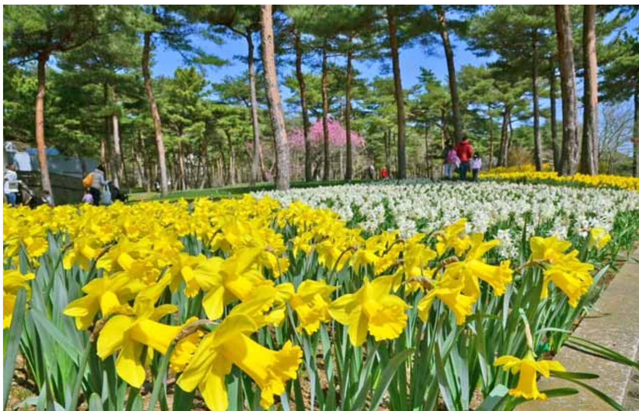
『スイセンガーデン』の、見頃を迎えた“エクセプション”(手前)と“ペーパーホワイト”(奥) 2013年3月26日撮影

「スイセンガーデン」の花々が見頃を迎えると、いよいよフラワーシーズンが幕を開けます。本格的な春の訪れを、昼夜で異なる「スイセンガーデン」の魅力とともに楽しみください。