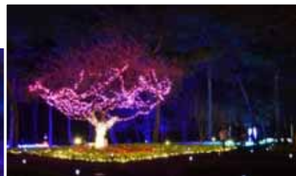
「スイセンみはらし台」では、イルミネーションに囲まれての休憩をお楽しみください。