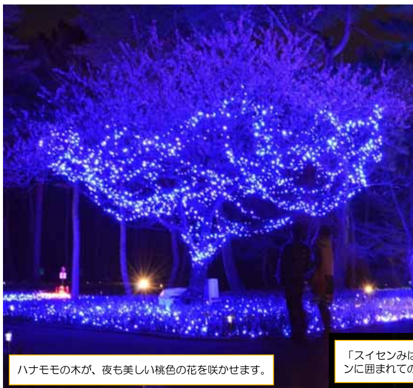
ハナモモの木が、夜も美しい桃色の花を咲かせます。