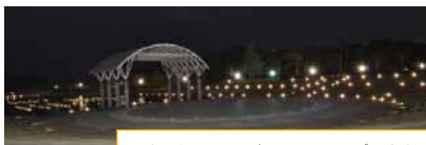
西池・水のステージもライトアップします。