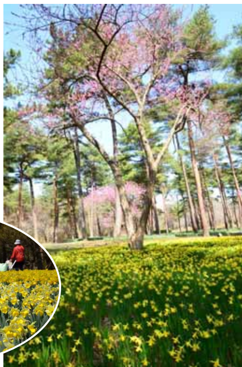
テタートとハナモモ