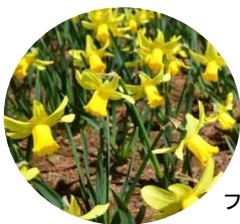
フェブラリーゴールド