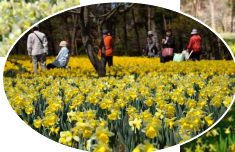
フォーサイド(手前)