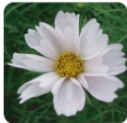
シーシェル 花びらが筒状に咲く変わり咲き品種です。