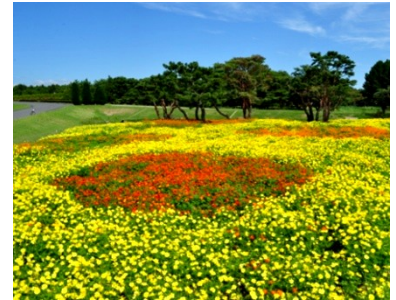
中央フラワーガーデン 2012年9月26日撮影

第3ガーデンは、「明るくPOPに！」をテーマにキバナコスモスを配置。黄色がベースになっていて、その中にオレンジと赤系のキバナコスモスをアクセントとして配置しました。