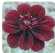
チョコレートコスモス チョコレート色で、一重咲き。チョコレートの香りがする品種です。