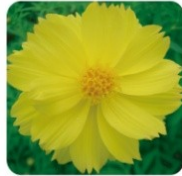
カーベットイエロー 暑さに強いキバナコスモスの品種です。