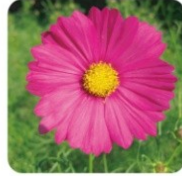
クリムゾンキャンパス クリムゾン色が特徴の遅咲き品種です。