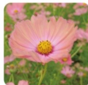
オレンジキャンパス 世界的にも珍しい淡いオレンジの花色が特徴の品種です。