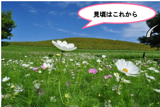
みはらしの丘 2012年9月26日撮影

今年の「みはらしの丘」には「センセーション」を4品種植えています。丘の裾野から順に、白、ピンク、赤、濃い赤とグラデーションになるよう配色(配合)を変えていて、コキアの紅葉の時期には、裾野から頂上にかけて、丘全体でグラデーションが楽しめるデザインになっています。