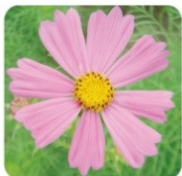
センセーション もっともポピュラーな早咲き品種です。