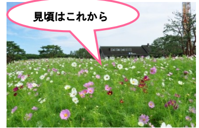
中央フラワーガーデン 2012年9月26日撮影