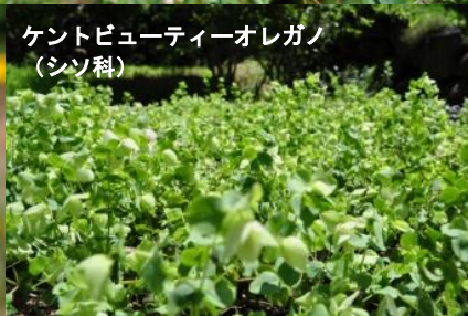
ケントビューティーオレガノ (シソ科)