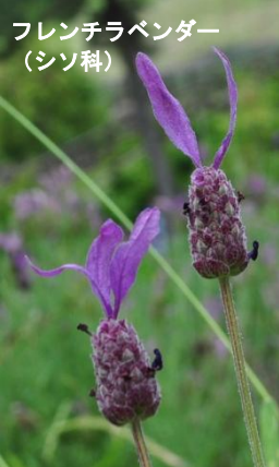
フレンチラベンダー (シソ科)