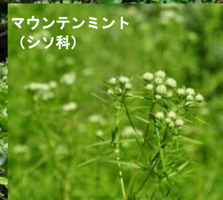
マウンテンミント (シソ科)