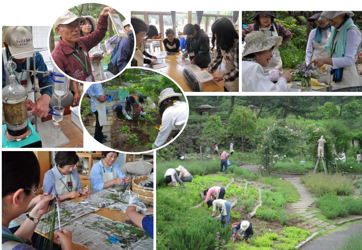
ハーブパートナーの活動風景