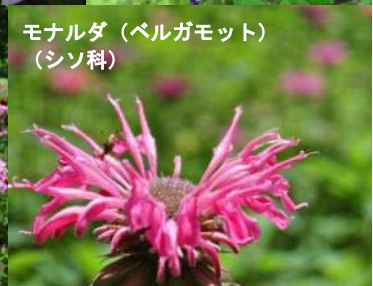
モナルダ (ベルガモット) (シソ科)