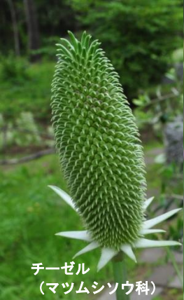
チーゼル (マツムシソウ科)