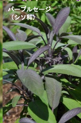
パープルセージ (シソ科)