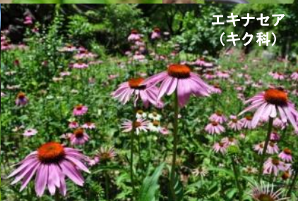
エキナセア (キク科)