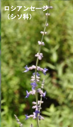
ロシアンセージ (シソ科)