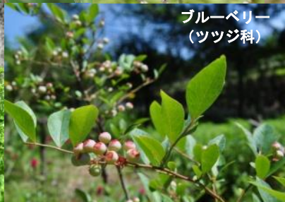
ブルーベリー (ツツジ科)