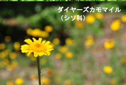
ダイヤズカモマイル (シソ科)