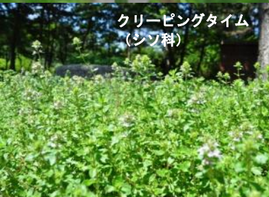
クリーピングタイム (シソ科)