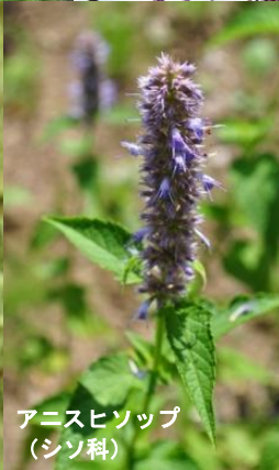
アニスヒソップ (シソ科)