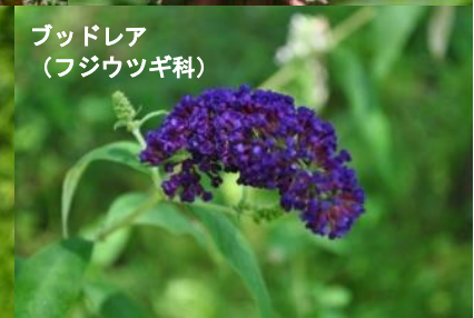
ブッドレア (フジウツギ科)