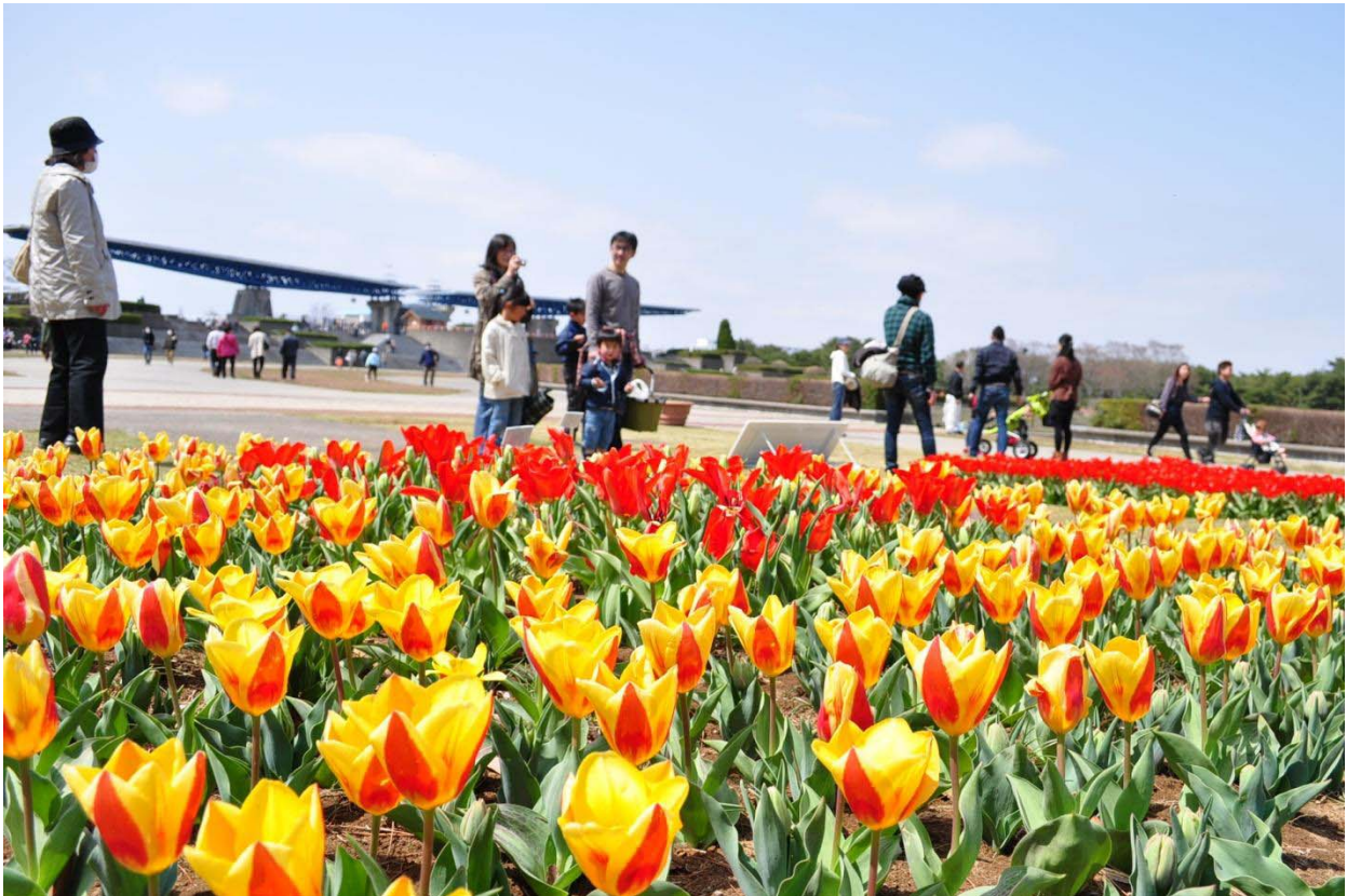
震災から約1か月後 一部無料開園後の園内の様子 (2011年4月10日撮影)

平成23年度、国営ひたち海浜公園の年間入園者数が、 986,311人 、 前年比32.4%減 （472,496人減）となりました。東日本大震災の影響により、春のフラワーシーズンである4月、5月に入園者数が大きく落ち込みましたが、徐々に持ち直し、コキアの紅葉シーズンである10月単月には前年並みにまで回復しました。その後、厳冬の影響を受けて花の開花が遅れた影響もあり、2月、3月の入園者数は再び伸び悩み、震災以降の観光自粛ムードや風評被害の影響を受けながらも、年間で100万人近い方々に来園いただきました。