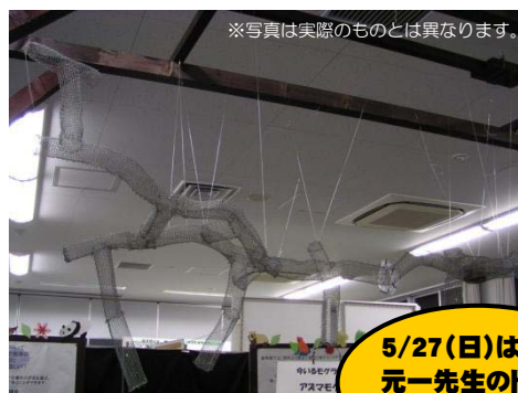
※写真は実際のものとは異なります。

金網でつくったトンネルで、モグラの暮らしを観察します。エサを与えるパクパクショーも行います。（左）