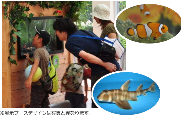
※展示ブースデザインは写真と異なります。