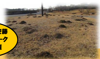
公園内各所にあるモグラ塚

僕たちは体がいつも物に触れていると安心するんだ。だから体と同じくらいの金網トンネルだと土の中のトンネルと同じ生活が出来るんだね♪