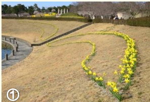
2014年3月29日撮影 縁は「フェブラリーゴールド」 約1,200本