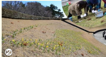
2015年3月10日撮影 翼の縁の中は「テタート」 約19,000本

2013年11月から、3年をかけて西池の周りの斜面に“飛翔”をイメージした翼の形に植えたスイセン。今春ついに完成した姿をご覧ください。見頃時期：3月下旬