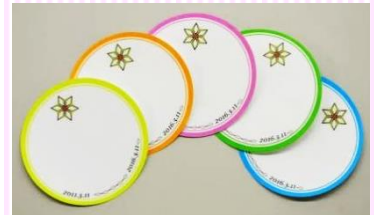
メッセージシール 透明光沢フィルム 直径：6.6cm

今回のイベントを通じて、東日本大震災から5年の年月を思い返し、また、未来に想いを馳せる機会にしたいと考えています。多くの方の想いを込めたメッセージをお待ちしております。