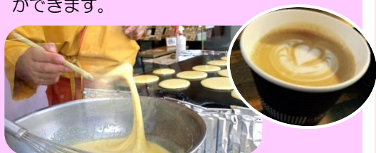
（左）どら焼き実演販売（右）ラテアート

県内の“モノづくり”職人による“職人技”や“手しごと”を現地で実演・体験！ どら焼きの実演販売や、バリスタによるコーヒーの販売（ラテアートも描いてもらえます♪）、デコパージュなどを体験することができます。