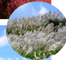
みはらしの丘のコキアがある裏側ではススキが見頃です