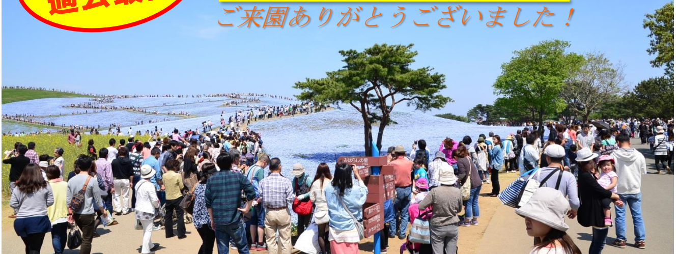
一日の入園者数が開園以来の過去最高を記録した日の“みはらしの丘”(2014年5月4日)