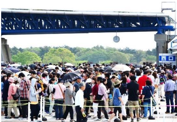
ゲート前に並ぶ来園者(2014年5月3日)