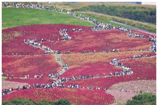
紅葉したコキアを見に訪れた来園者(2014年10月18日)

平成26年度、国営ひたち海浜公園の年間入園者数が、 過去最高であった東日本大震災前の平成21年の記録(1,496,799人)から270,932人上回り、1,767,731人となりました ので、ご報告いたします。